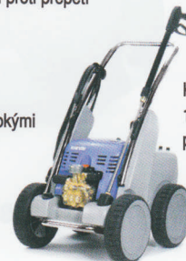
Kränzle 1000 TS, 1200 TS bez bubnu pro navinutí hadice.

velká kola s širokými pneumatikami z plné gumy